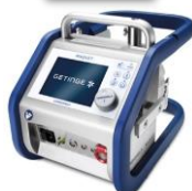
Cardiohelp de Getinge