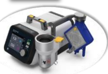
Rotaflow II de Getinge