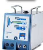
HU35 de Getinge