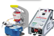
Consoles Colibri / Ecmolife de Eurosets